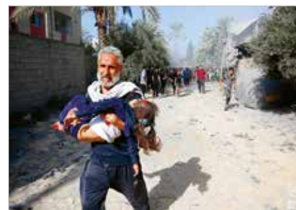
Appell für die Evakuierung schwerverletzter Kinder

In der Vergangenheit haben sich vergleichbare Planungen rund um sogenannte kleine und modulare AKW immer wieder als unrealistisch und als aus technischen und wirtschaftlichen Gründen nicht umsetzbar erwiesen. Der Zeitplan erscheint jedenfalls kaum einhaltbar. Die Standortfrage ist offen. Das Unternehmen nennt teils nicht weiter spezifizierte Orte in den Bundesstaaten Texas, Utah und Kansas.