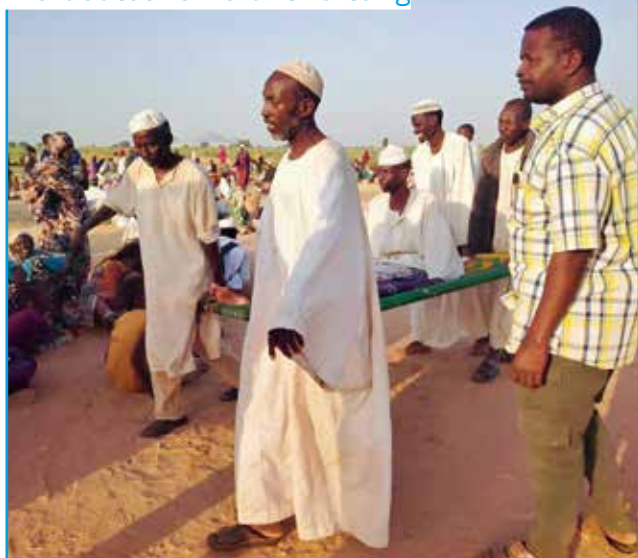
General Coordination of Displaced Persons and Refugees in Darfur