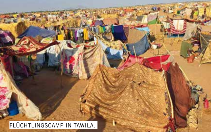
FLÜCHTLINGSCAMP IN TAWILA.