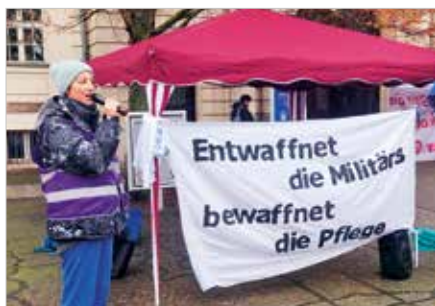
Bundeswehr-Oberst bei Charité-Symposium eingeladen

Im Rahmen des Symposiums „Zivile Notfall- und Rettungsmedizin. Bevölkerungsschutz“ an der Berliner Charité sollte eigentlich am Donnerstag, 20. November 2025, Bundeswehr-Oberst Zimmermann im Kontext des Themenblocks „Zivile Verteidigung – Vorbereitung deutscher Krankenhäuser am Beispiel Berlin“ über den „Operationsplan Deutschland“ sprechen. Der „Operationsplan Deutschland“ ist das wichtigste Planungsdokument für die Zusammenarbeit von Militär und zivilen Infrastrukturen. Auf der Ebene des Berliner Gesundheitswesens werden diese Vorgaben u. a. weiterentwickelt im kürzlich fertiggestellten „Rahmenplan Zivile Verteidigung Krankenhäuser Berlin“.