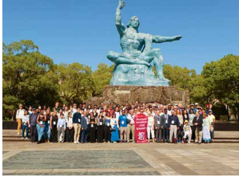
NAGASAKI: KONGRESSTEILNEHMER*INNEN LEGEN BLUMEN NIEDER.

ist von entscheidender Bedeutung. Als Heilberufler*innen, Wissenschaftler*innen und Beschützer*innen des Lebens ist es unsere Pflicht, dafür zu sorgen, dass die Gefahren des Krieges – insbesondere die existenzielle Bedrohung durch die nukleare Vernichtung – vollständig verstanden werden. Wir müssen verhindern, was wir nicht heilen können. Und wir müssen uns daran erinnern: Empathie und Mitgefühl sind Teil der menschlichen Natur.