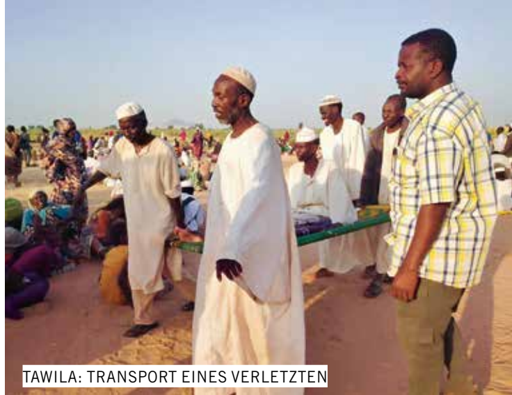
TAWILA: TRANSPORT EINES VERLETZTEN

legen die Hinweise darauf, dass französische Militärtechnologie über die VAE an die RSF weitergereicht wurde.