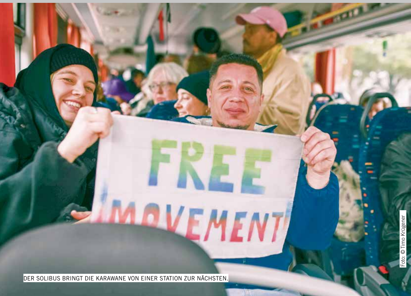
DER SOLIBUS BRINGT DIE KARAWANE VON EINER STATION ZUR NÄCHSTEN.