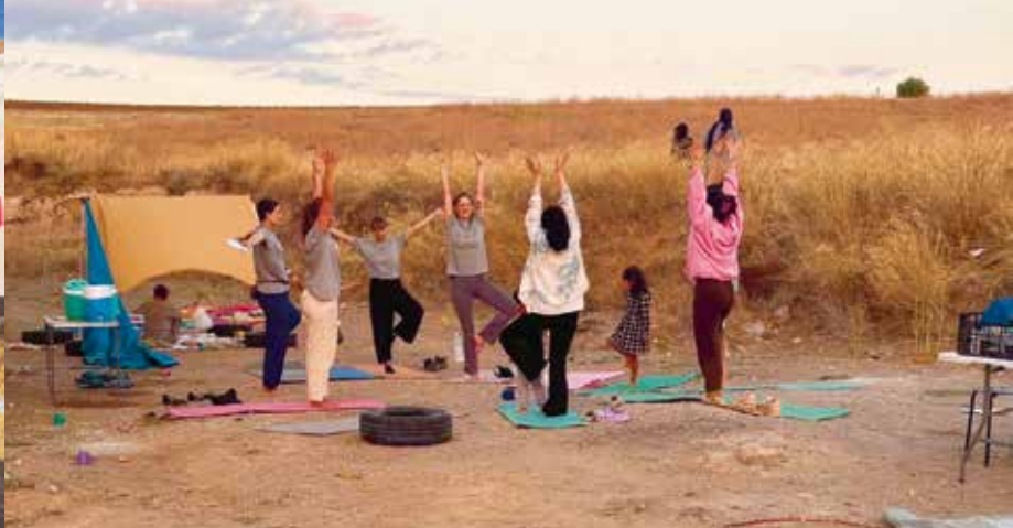
ROSA UNTERSTÜTZT FRAUEN UND MÄDCHEN AUF DER FLUCHT.