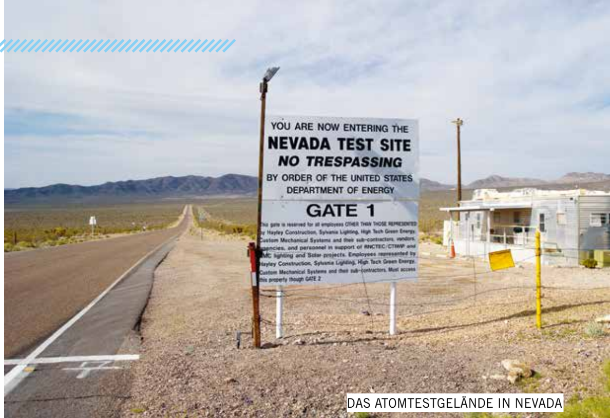
DAS ATOMTESTGELÄNDE IN NEVADA

indigene Gruppen entlang der nördlichen russischen Küste waren von der radioaktiven Kontamination betroffen.