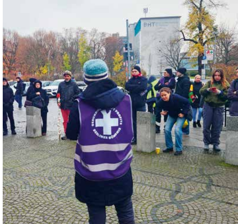
GEMEINSAMER PROTEST VON GESUNDHEITSINITIATIVEN AM VIRCHOW-KLINIKUM ANLÄSSLICH DES SYMPOSIUMS „ZIVILE NOTFALL- UND RETTUNGSMEDIZIN“ AM 21. NOVEMBER 2025 IN BERLIN

zumal vor dem Hintergrund der kaum verhohlenen Atomkriegsdrohungen, die die russische Regierung bei jeder Diskussion um neue Waffengattungen für die Ukraine verstärkt. Vorbereitungen des Gesundheitssystems auf einen Atomkrieg sind weitgehend sinnlos, wie die IPPNW seit 40 Jahren immer wieder erklärt, weil nach einer Atombombenexplosion kaum medizinisches Personal oder medizinische Infrastruktur übrig sein wird, um den Hunderttausenden Hilfebedürftigen eine auch nur halbwegs wirksame Versorgung anbieten zu können.