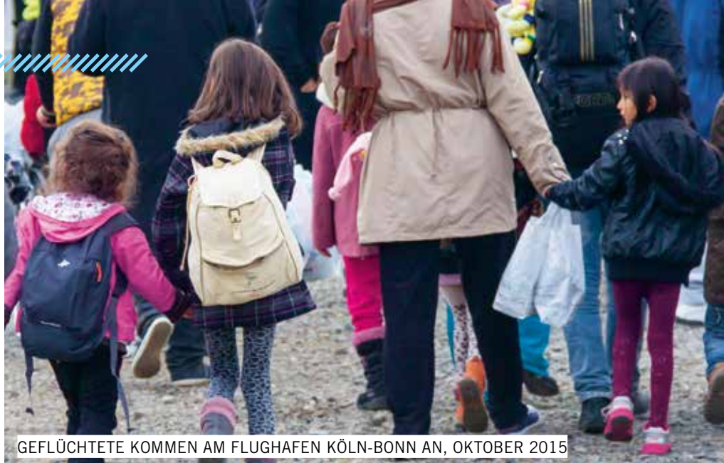
GEFLÜCHTETE KOMMEN AM FLUGHAFEN KÖLN-BONN AN, OKTOBER 2015