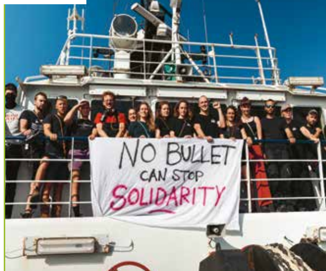
Carla Marmette / Sea-Watch