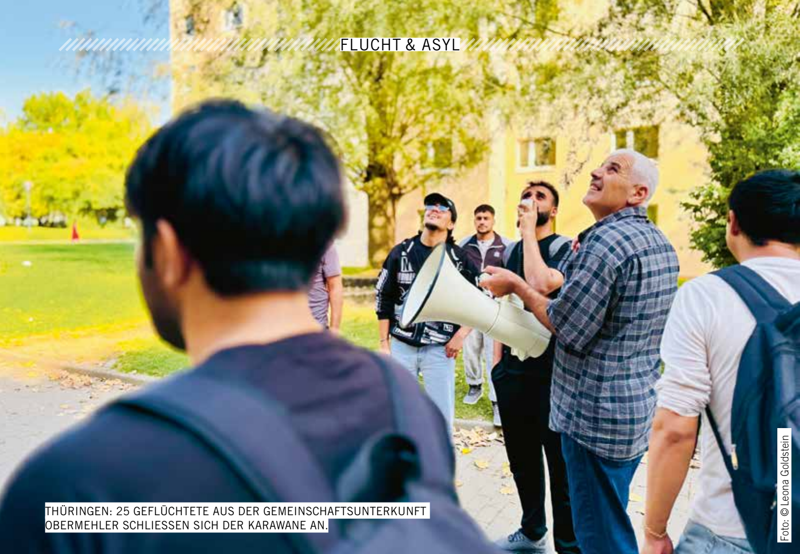
THÜRINGEN: 25 GEFLÜCHTETE AUS DER GEMEINSCHAFTSUNTERKUNFT OBERMEHLER SCHLIESSEN SICH DER KARAWANE AN.