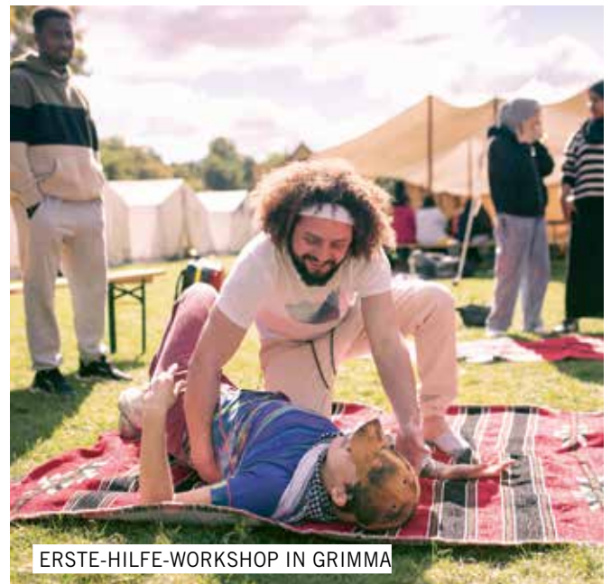
ERSTE-HILFE-WORKSHOP IN GRIMMA

Text zusammengefasst aus der Reportage von Timo Krügener und Leona Goldstein im Reversed Magazine . Die Reportage vom 29.09.2025 finden Sie hier: ippnw.de/bit/karawane