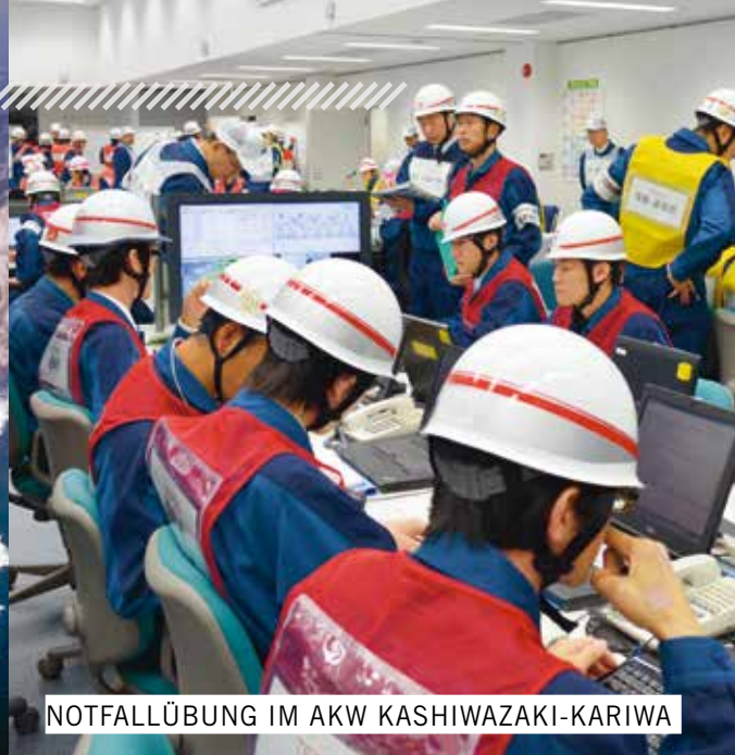
NOTFALLÜBUNG IM AKW KASHIWAZAKI-KARIWA