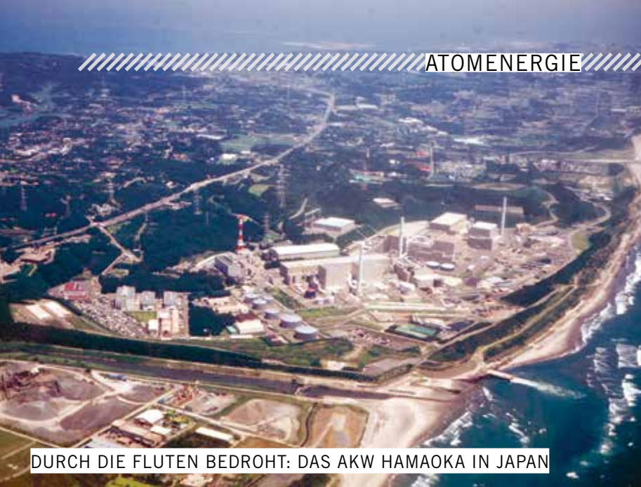
DURCH DIE FLUTEN BEDROHT: DAS AKW HAMAOKA IN JAPAN