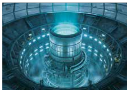
Unterirdischer Atomreaktor für KI-Rechenzentren?

Infos und Petition zum Thema Militarisierung: ipnw.de/bit/militarisierung