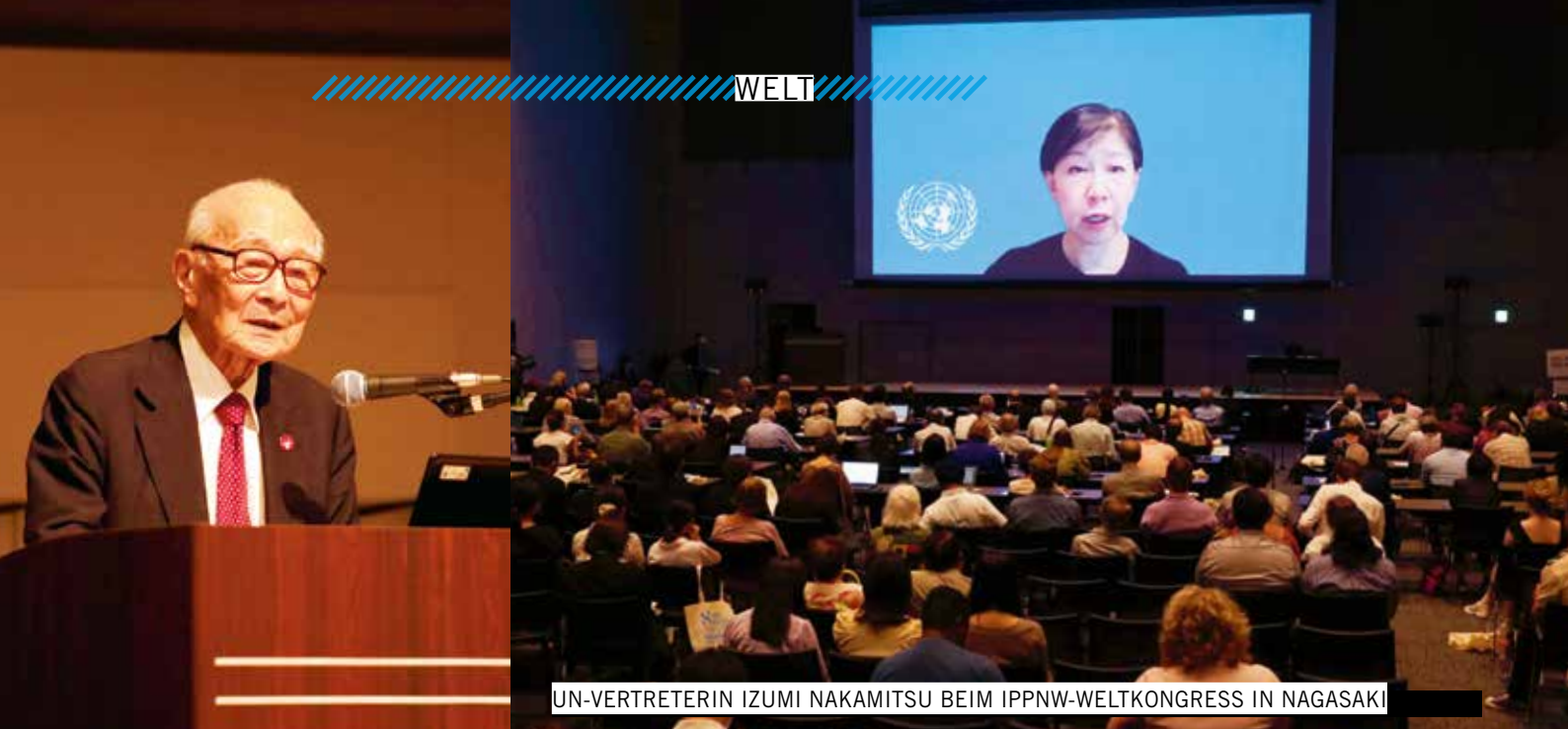
UN-VERTRETERIN IZUMI NAKAMITSU BEIM IPPNW-WELTKONGRESS IN NAGASAKI