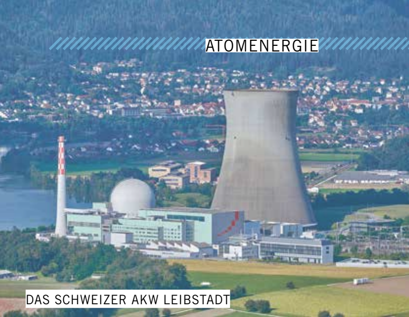
DAS SCHWEIZER AKW LEIBSTADT