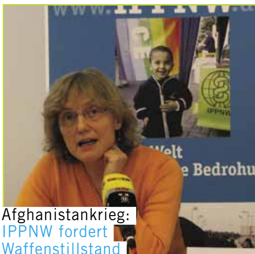
Afghanistankrieg: IPPNW fordert Waffenstillstand