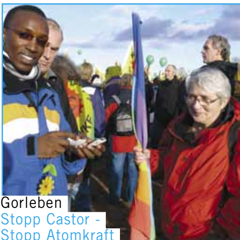
Gorleben Stopp Castor - Stopp Atomkraft

Das Jahr 2010 ist geprägt von der Debatte um die von der Bundesregierung geplanten Laufzeitverlängerungen für Atomkraftwerke . Von Januar bis Oktober begleitet die IPPNW diese sich abzeichnende politische Fehlentscheidung der Regierung von Bundeskanzlerin Angela Merkel mit zahllosen Analysen und kritischen Stellungnahmen.