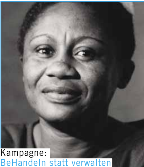
Kampagne: BeHandeln statt verwalten

November Der Bundestag verabschiedet einen Antrag der Regierungsfractionen zur Gesundheitsreform . Die IPPNW kritisiert die geplanten Zwangsmaßnahmen zur Einführung der Gesundheitskarte. Danach sollen Praxisärzte bei Androhung eines kompletten Honorarverlusts künftig gezwungen werden, ihre Praxen an zentrale Computerstrukturen anzuschließen. Das schließt sensible Patientendaten mit ein.