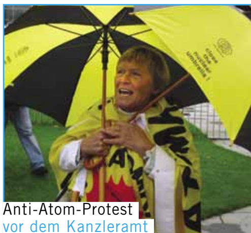
Anti-Atom-Protest vor dem Kanzleramt