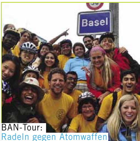
BAN-Tour: Radeln gegen Atomwaffen

August Höhepunkt dieses Jahres ist der 19. IPPNW-Weltkongress in Basel im Rahmen dessen die deutsche IPPNW zwei Vorkongresse organisiert zu den Themen Uranabbau und Posttraumatische Belastungsstörungen. Beim Vorkongress zum Uranabbau werden ein Aufruf der internationalen IPPNW für ein weltweites Verbot des Uranabbau und eine gemeinsame Erklärung der teilnehmenden VertreterInnen indigener Völker verabschiedet. Hauptthema des Weltkongresses ist die Abschaffung aller Atomwaffen. Geschätzte 100 Kongressbesucher kommen aus Deutschland. Auf dem International Council Treffen wird Dr. med. Lars Pohlmeier zum Vize-Präsidenten für Europa gewählt.