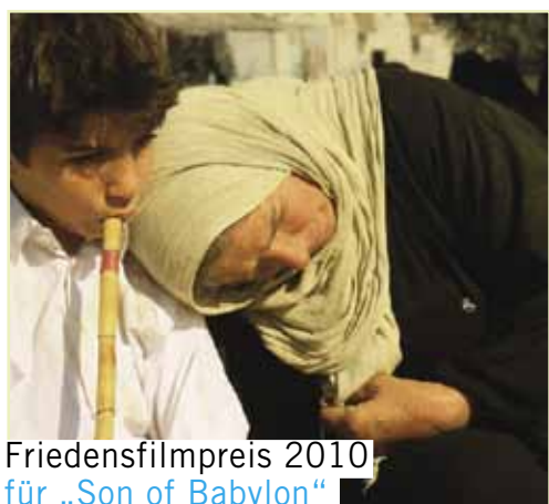
Friedensfilmpreis 2010 für „Son of Babylon“

„Son of Babylon“ erhält den 25. Friedensfilmpreis . Der Film schildert die Suche des kurdischen Jungen Ahmed und seiner Großmutter nach Ahmeds Vater im Irak. Die Jury des Friedensfilmpreises urteilte: „Ein Film über Schuld, Wahrheit, Reue und Vergebung und über die Stärke der Großmütter, die die ganze Welt in ihren Händen halten: Eine lange Reise.“