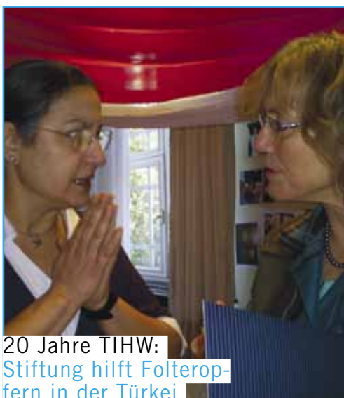
20 Jahre TIHW: Stiftung hilft Folteropfern in der Türkei