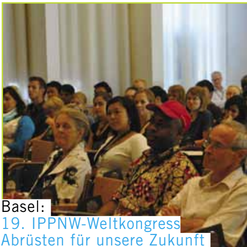
Basel: 19. IPPNW-Weltkongress Abrüsten für unsere Zukunft

Januar Zu Beginn des Jahres startet die zweite Phase des Internetstudiums für medizinische Friedensarbeit (Medical Peace Work) , das von der EU finanziert wird. Das Studium informiert Gesundheitspersonal in sieben Onlinekursen über die Folgen von Krieg und anderen Formen von Gewalt für die Gesundheit von Individuen und Bevölkerungsgruppen. Themen sind Abrüstungsarbeit und (Atom-)Kriegsvorbeugung, Menschenrechte, strukturelle Gewalt sowie friedensfördernde Arbeit während und nach Kriegssituationen. IPPNW Deutschland hat die Öffentlichkeitsarbeit für das Projekt übernommen. ( www.medicalpeacwork.org )