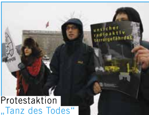
Protestaktion „Tanz des Todes“