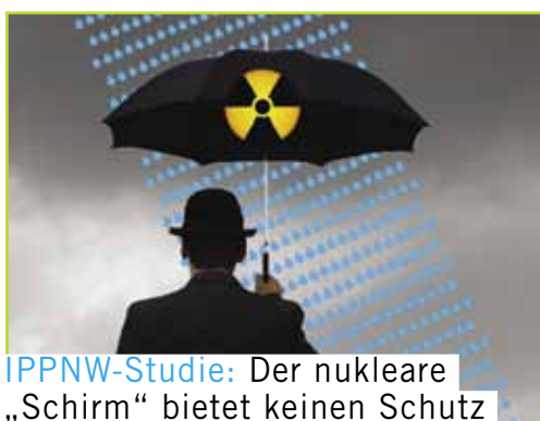
IPPNW-Studie: Der nukleare „Schirm“ bietet keinen Schutz

Mit dem Factsheet „Medizinische Folgen von Uranmunition“ informiert die IPPNW über die Einsätze von Uranmunition, deren mögliche gesundheitliche Folgen und neuere Forschungsergebnisse.