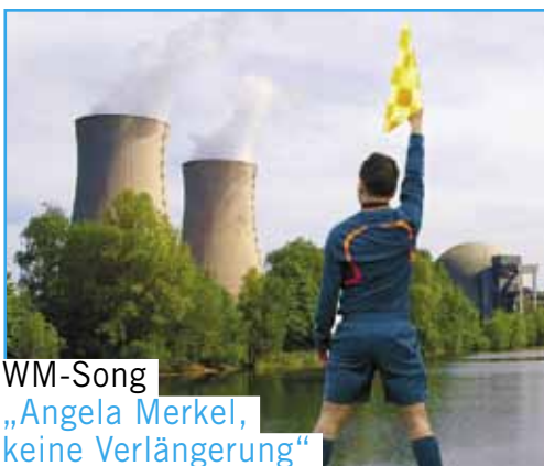
WM-Song „Angela Merkel, keine Verlängerung“