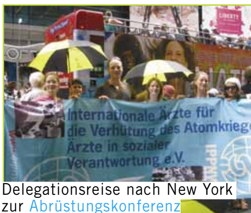
Delegationsreise nach New York zur Abrüstungskonferenz

Mai In New York übergibt eine IPPNW-Delegation 16.000 Unterschriften für eine Welt ohne Atomwaffen an den Vorsitzenden der Überprüfungskonferenz Libran Cabactulan.