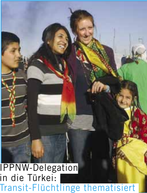
IPPNW-Delegation in die Türkei: Transit-Flüchtlinge thematisiert