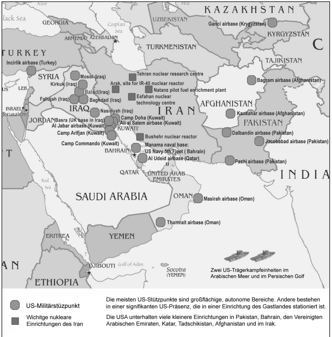
Diese Landkarte des Nahen und Mittleren Ostens zeigt US-amerikanische Militärstandorte in der Region und die iranischen Atoanlagen.